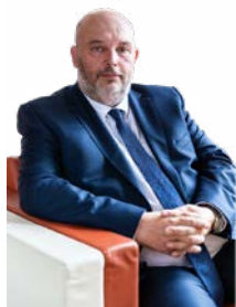
Miroslav Toman ministr zemědělství

Práce zemědělců je každodenní práce 365 dnů v roce, a to bez ohledu na počasí a různé překážky. Zvykli jsme si, že dostupnost potravin je samozřejmá, pořád ale platí, že potraviny nevznikají v obchodech, ale na poli a ve stájích. Ano, zvláště péči o zvířata není možné nikdy přerušit. A za tím vším je právě ta každodenní práce našich zemědělců, kteří nemohou práci na měsíc zastavit a potom se k ní vrátit, takto zkrátka zemědělství nefunguje. Ostatně potvrdil to i loňský nástup koronavirové pandemie a měsíce, které následovaly. Bez ohledu na situaci jsme stále měli co jíst. Chci proto všem zemědělcům poděkovat za úsilí a za mnoho hodin těžké a poctivé práce.